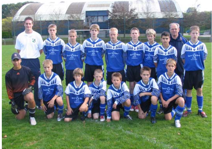
Die C-Jugend vor ihrem Spiel gegen den AS Brest

Am Vormittag wurde, unmittelbar im Anschluß an das Frühstück, der vor zwei Tagen ab gesagte Besuch des größten fran-zösischen Meeresaquariums, das „Océanopolis“, das zu den 10 größten Aquarien Europas gehört, durchgeführt. Im Anschluß an das Mittagessen ging es um 13:15 Uhr zu den Rückspielen auf die Sport-anlagen im „Parc d'Ecole“ ge-legen. Die heutigen Gegner waren Jugendmannschaften des AS Brest. Die C-Jugend bekam es ab 14:15 Uhr mit der zweiten C-Jugendmann-schaft des AS Brest zu tun, und hatte bei ihrem 5:2 Sieg wenig Mühe. Anders bei den D-Jugendlichen, die sich ab