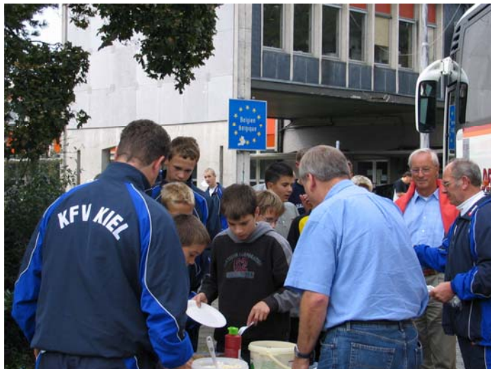
Mittagspause an der belgischen Grenze