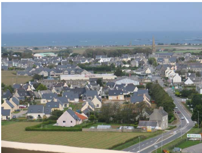
Blick aus der Creperie „Le Chateau d’eau“ auf Ploudalmezeau

An diesem Tag stand zunächst ein Ausflug in die nördlich Brest gelegenen Landesteile, der Finistere“ (Ende der Erde) auf dem Tagesprogramm. Nach dem Frühstück führte uns die Fahrt zunächst durch Brest mit seinen Hafenanlagen, vorbei am Chateau de Brest mit der darin beheimateten Militärakademie, später entlang des Küstenverlaufs nach „Plougonvelin“. Hier bestand die Möglichkeit einen typischen französischen Wochenmarkt zu besuchen und den Küstenstreifen dieser interessanten Landschaft zu Fuß zu erkunden. Anschließend fuhren wir entlang des nördlichen Küstenabschnitts nach Ploudalmezeau.