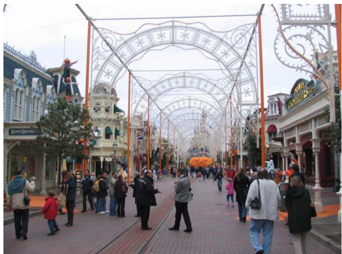
Die „Main Street“ im Disneyland