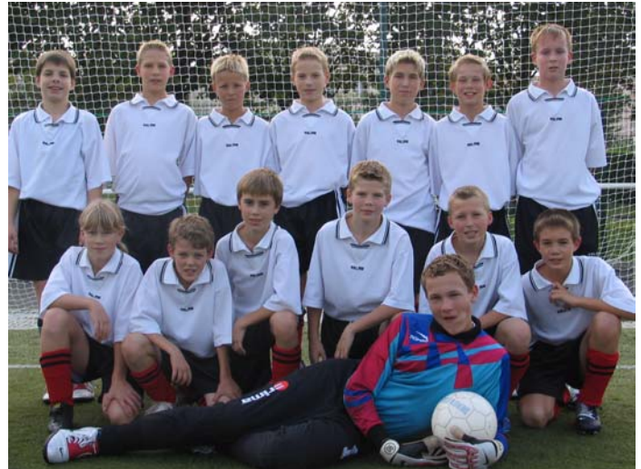
Die D-Jugend vor ihrem ersten Spiel

zubereiten. Um 17:00 Uhr erfolgte dann die Abfahrt zu den Spielen in das „Stade de Penhelen“ in Brest. Hierbei handelt es sich um eine Sportanlage, die Eigentum des AS Brest ist, und üblicherweise nur von der Profimannschaft des AS Brest genutzt werden darf. Anstoß für das Spiel der D-Jugend gegen eine Stadtauswahl aus Brest war um 18:00 Uhr. Nachdem die erste Halbzeit noch ausgeglichen gestaltet werden konnte (1:1), ging das Spiel dann doch noch deutlich mit 1:5 verloren. Um 19:45 war dann die C-Jugend an der Reihe. Obwohl diese sich etwas besser aus der Affäre ziehen konnten, ging das Spiel mit 2:0 für den Gastgeber aus.