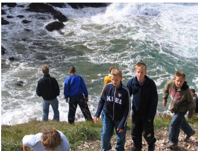
An der Steilküste des Pointe de Pen-Hir

Nach der, für die Jugendlichen an deutschen Maßstäben gemessenen ungewöhnlichen Art des Frühstücks um 08:30 Uhr – keine Unterlage zum schmieren der Brote und trinken aus Müslischüsseln – brachen wir um 10:00 Uhr zur südlich von Brest gelegenen Halbinsel Crozon auf, die die bizarre Landschaft der Bretagne in eindrucksvoller Weise darstellt.